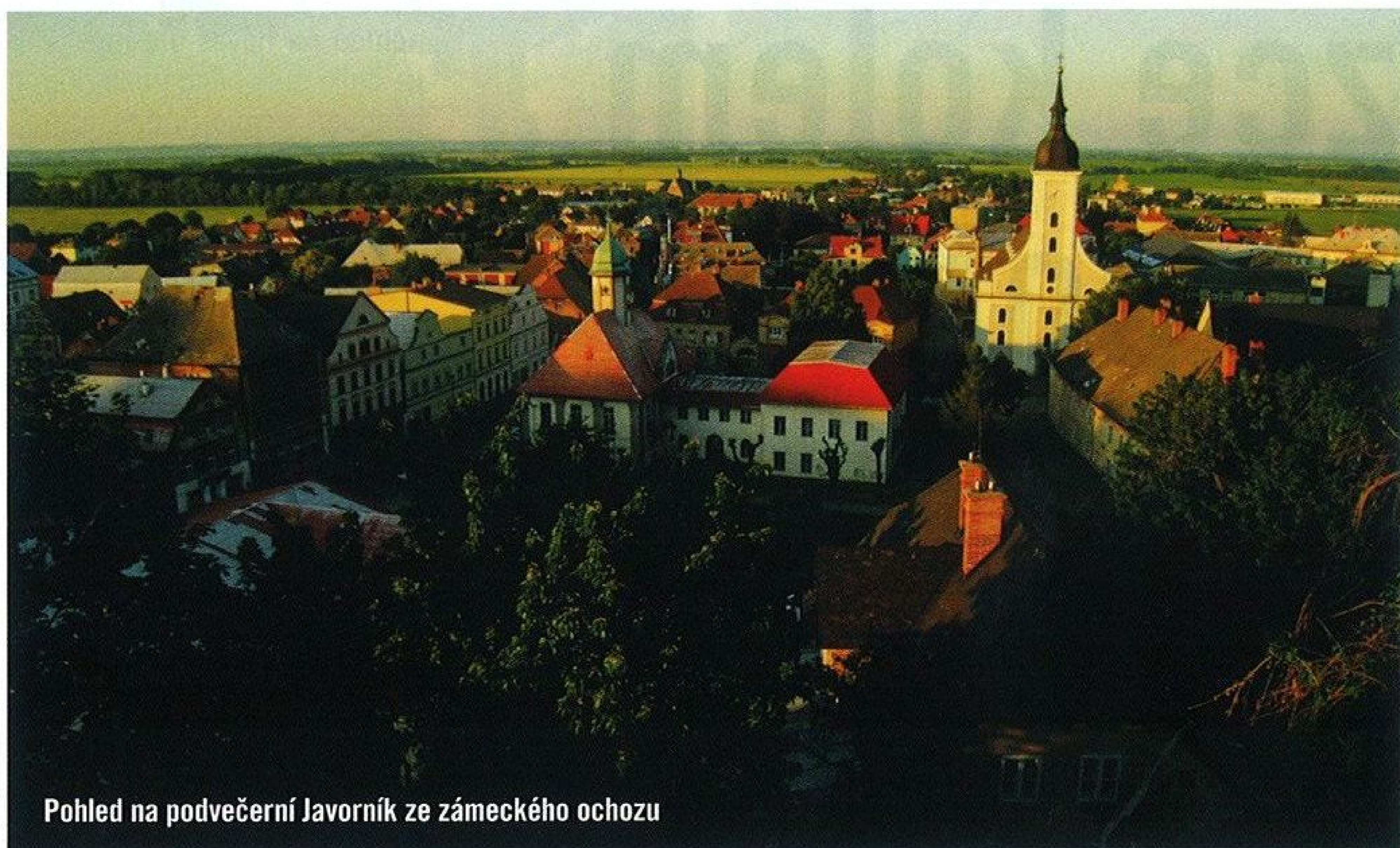
Pohled na podvečerní Javorník ze zámeckého ochozu

Zpět do Javorníka je to odtud jen kousek, a navíc z kopce, takže spěchat nemusíte, užijte si to.